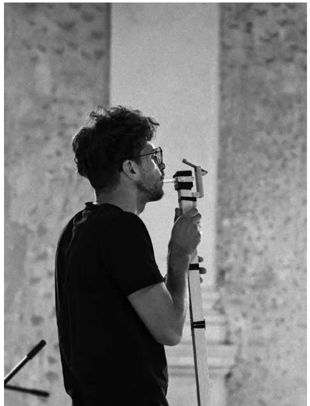
4–7 pav. Proceso „Instrumental“ metu sukurti nauji garso objektai – instrumentai.