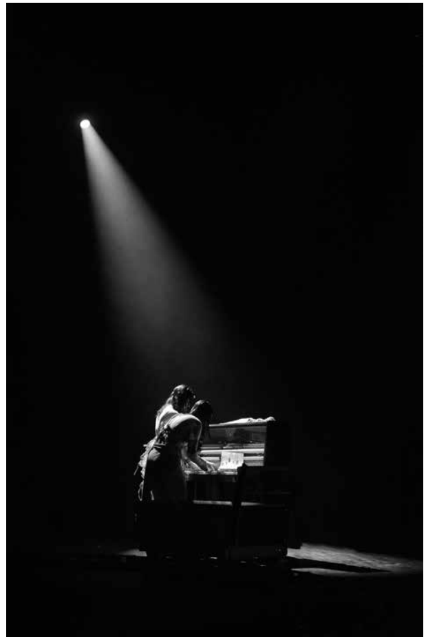
2–3 pav. Fizinio teatro ir muzikos performansas „Kompostas“.