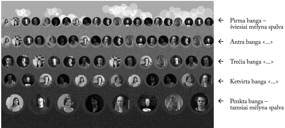
2 pav. Virtualus choras – galutinis vizualizacijos variantas