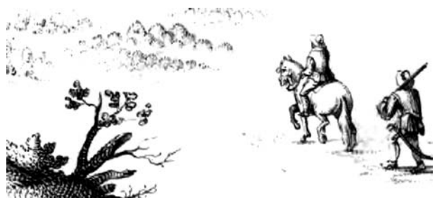
10 pav. B. Gedkanto sudaryto Vyslos atragio tvirtovės Montauer Spitz žemėlapio puošybos fragmentas. Švedijos nacionalinis archyvas, karo istorijos padalinys: Kriksarkivet, Handritade Kartverk, Band 28: Topographica practica (Getkant, 1634–1639), SE/KrA/0414/0028/0008