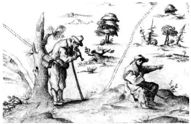
8 pav. B. Gedkanto 1638 m. sudaryto Lvovo žemėlapio puošybos fragmentas.

Koks objektas (jame įkomponuota atminimo įrašo melodija) – padargas, užtvaro segmentas ar dar kas – remiasi į dvikamienio medžio kelmą? Visas piešinėlis atrodo tipiškas „gedkantiško“ stiliaus fragmentas. B. Gedkantas išties pasižymėjo daugybe įvairių talentų, vienas jų – piešimo. Kai kurie jo sudaryti žemėlapiai yra itin asketiški, tačiau dauguma jų, kaip tais laikais įprasta, ne tik dalykiškai pildomi piešiamais schematizuotais pastatais, įtvirtinimais, miniatiūriniais miškais, krūmynais, bet ir puošiami medžių, laukinių pievų, gėlių paveikslėliais. Ne sykį jis naudojo puošybai ir nukirsto, nupjauto ar nulūžusio medžio įvaizdį, suteikiantį piešiniui ypatingos nuotaikos (8–10 pav.). Kaip jau minėta, nepaprastos gyvybės sudėtingiems kartografijos kūriniams suteikia ir miniatiūrinės gyvūnų bei žmonių gyvenimo scenelės, o Gdansko žemėlapio jūroje net „apgyvendinamas“ mitinis vandens gyvis – žuvis pelėdos galva. Vis dėlto nieko panašaus į melodiją „laikantį“ objektą B. Gedkantas daugiau nenupešė, tad nei palyginti, nei identifikuoti šio daikto nepavyko.