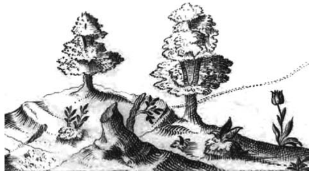
9 pav. B. Gedkanto 1635 m. sudaryto Gnievo ( Mewe ) žemėlapio puošybos fragmentas. Švedijos nacionalinis archyvas, karo istorijos padalinys: Kriksarkivet, Handritade Kartverk, Band 28: Topographica practica (Getkant, 1634–1639), SE/KrA/0414/0028/0007