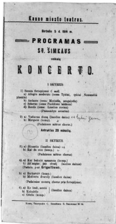
1 pvz. Kauno miesto teatras. Birželio 5 d. 1914 m. Programas St. Šimkaus veikalų koncerto, http://www.epaveldas.lt/object/recordDescription/LNB/C1BC1R0000132093 [žiūrėta 2014 08 25]