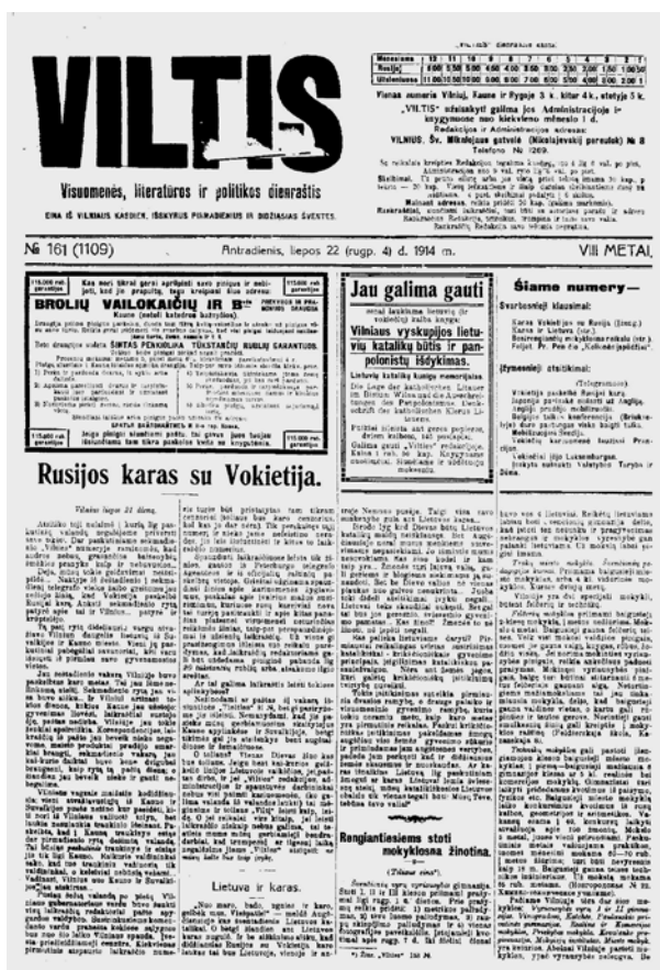
2 pvz. „Vilties“ laikraštis, titulinis puslapis, 1914, Nr. 161, liepos 22 d. (rugpjūčio 4)

„Vilniaus tautų visuomenės gyvenime taipos yra įvykusių šokių tokių atmainų. Inteligentų, galima sakyti, dauguma išvažinėjo; laikraščių išcina mažiau. Kai dėl lietuvių laikraščių, tai kurį laiką jie buvo visai nustoję eiti. Dabar, be „Lietuvos Žinių“, yra pasirodžiusios „Viltis“ ir „Aušra“. Lenkų „Kurjer Litewski“ ir rusų „Vilenskij Vestnik“ išsikėlė. „Kurjer Litewski“ vieton Vilniuje išcina „Maly Kurjer“, o didysis eina iš Minsko pasivadinęs „Nowy Kurjer Litewski“.