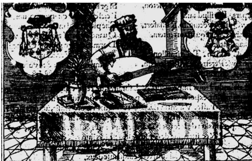
1 pav. Liono liutnios tabulatūra, titulinio lapo fragmentas: graviūra, kurioje (tikėtina) vaizduojamas pats Valentinas Bakfarkas (1553)