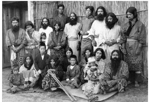
1 pvz. Ainų bendruomenė (iš 1890–1900 m. nuotraukų albumo)

Ainų etnogenezės klausimas – vienas iš labiausiai ginčytinų ir sunkiai paaiškinamų šiuolaikinėje etnografijoje ir antropologijoje. Pagal antropologinį tipą ainai tarp Azijos tautų užima išskirtinę vietą. Ainų kalba – izoliuota, neturi bendrumų su jokia kita pasaulio kalba. Ainų kultūroje esama elementų, būdingų ir pietų (australidai), ir šiaurės (Sibiro) etnosams. Hipotezių, teorijų ir publikacijų apie ainų etnogenezę yra labai daug 10 . Egzistuoja kelios pagrindinės hipotezių apie jų kilmę grupės: 1) europidų; 2) kontinentinė (Azijos); 3) suartėjimo su Šiaurės Amerikos bendruomenėmis; 4) pietų (Okeanijos, australidų). Bene pagrįščiausias yra europidų ir pietų teorijos. Pastaruju metu, sparčiai pažengus genetikos mokslui, atlikti nauji ainų genetikos tyrimai. Įrodyta, kad ainai – ne europidai, bet pagal antropologinį tipą artimiausi jiems (ainų akys neįkypos kaip mongolidų, nosys – stambios, gymis gana šviesus, plaukai – ilgi, vešlūs ir banguoti).