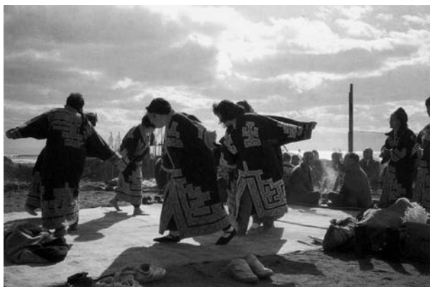
25 pvz. Ainų hararki „paukščių šokis“

Ainų dainų sėdint ( upopo ) skambesys etimologiškai siejamas su žodžiu upopo „triukšmingas dainavimas, kaip paukščių čiulbėjimas, čiauškimas“ 126 . Šokių dainose balsais ir judesiais imituojami gyvūnai, vabzdžiai (tai susiję su animizmu). Ypač dažnai mėgdžiojami paukščiai, pvz., Mukavoje yra žinomas hararki („paukščių šokis“, 25 pvz.) 127 ; „gervės šokį“ tsirumai (iš jap. tsuru „gervė“ ir mai „šokis“) mini vokiečių mokslininkas Heinrichas Botho Scheube, XIX a. tyrinėjęs ir detalai aprašęs meškos ceremoniją 128 .