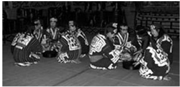
22 pvz. Upopo , dainuojama dviejų grupių kanonu, Mukavos apyl. 121

Kôchi, remdamasi naujausiais Tanimoto tyrimais 120 , atkreipia dėmesį į kai kuriuos svarbius momentus ainų tradicinio dainavimo atgaivinimo sąjūdyje. 1980-aisiais beveik visuose regionuose dainos sėdinti buvo imtos dainuoti tik unisonu. Tai tapo įprastu dalyku. Tuomet pajusta, kad ukouk dainavimo būdas (meistriškumas) gali išnykti. 1990 m., toliau gaivinant tradicinį ainų dainavimą, buvo išbandytas naujas ukouk dainavimo būdas – ne atskirų dainininkų, o kelių grupių dainavimas kanonu (nuotraukoje matyti, kaip upopo dainuoja dvi grupės, 22 pvz.). Toks dainavimo būdas, nors anksčiau tradicijoje niekada nebuvo žinomas, šiomis dienomis ima vyrtauti.