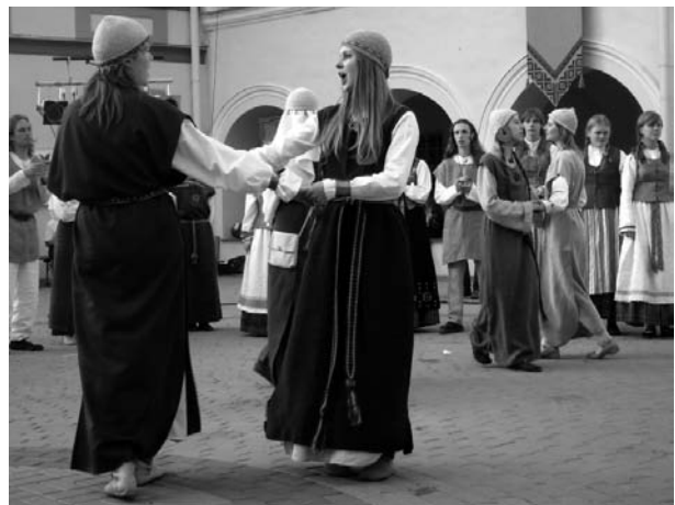
23 pvz. Šokamoji sutartinė, giedama dubliuojant balso partijas kelioms giedotojoms (nuotrauka iš 2011 m. tarptautinio folkloro festivalio „Skamba skamba kankliai“)

Įdomu, kad lygiai tokią pat tendenciją galima pastebėti šiandieniam sutartinių tradicijos gaivinimo etape. Dauguma nepatyrusių sutartinių giedotojų grupių vengia giedojimo po vieną – tą pačią balso partiją paprastai dubliuoja 2, kartais – 3 ir daugiau giesmininkų (23 pvz.). Taip giedoti, anot šiandienų sutartinių puoselėtojų, yra „drąsiau“, „paprasciau“, „lengviau“ (nėra pavojaus išklysti iš savo partijos, „nusidainuoti“), „garsiau“ ir pan.