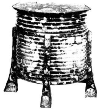
5 pvz. Ritualinis indas „šintoki“ (Sarashina, Tanimoto, Masuda, 1965)

Anot Nabuhiko Chibos, ainų grupinis dainavimas žinomas kaip upopo 60 . Upopo ainų kalba reiškia „daina“ (iš esmės tai švenčių daina – D. R.-I. 61 ), ji atliekama sėdint, daugiausia moterų. Upopo pradedama, kai vyras, pasibaigus ritualui arba ceremonijai, atneša nuo garbingo altoriaus indo „šintoki“ ( hokai , 5 pvz.) dangtį ir paduoda jį senolei ( fuči ). Moterys sėdi aplink indo dangtį, ritmiškai stuksi rankomis į dangtį ir ratu dainuoja kanoną. Sakoma, kad dainuojant