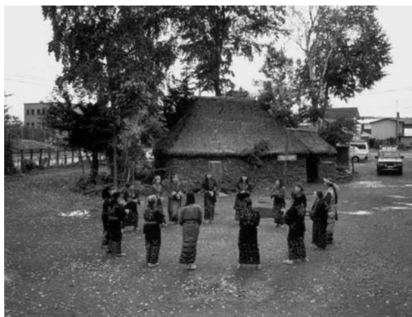
29 pvz. Ainų rato šokis (fotografuota 1999 m.) 143

Neatsitiktinai vienas iš trejinių (kanoninių sutartinių) liaudiškų pavadinimų – apskrita : „Sutartinė apskrita, sektinė, trijūs.“ 140 Žinomas ir pasakymas aplinkui giedoti : „Viena pradeda, tuoj kita pagauna, iš tos trečia, ir taip eina aplinkui, kiek tų giedotojų yra.“ 141 Giedojimas ratu, be abejo, nedalomai susijęs ir su choreografija. Būdingas sutartinių šokių elementas – vaikščiojimas ratu: a) susikabinus rankomis; b) nesusikabinus, viena paskui kitą; c) sudėjus po vieną ranką į vidurį („žvaigždutė“) ir kt. Ainų upopo , kaip jau minėta, dainuojamos ratu: moterys sėdi aplink ritualinio indo dangtį, ritmiškai stuksi į dangtį rankomis ir dainuoja kanoną. Rimse – rato šokis 142 – kartais, kaip ir upopo , dainuojamas kanonu (29 pvz.).