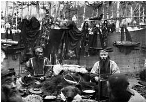
3 pvz. Meškos ceremonijos fragmentas: puota po lokio nužudymo (B. Pilsudskio nuotrauka)