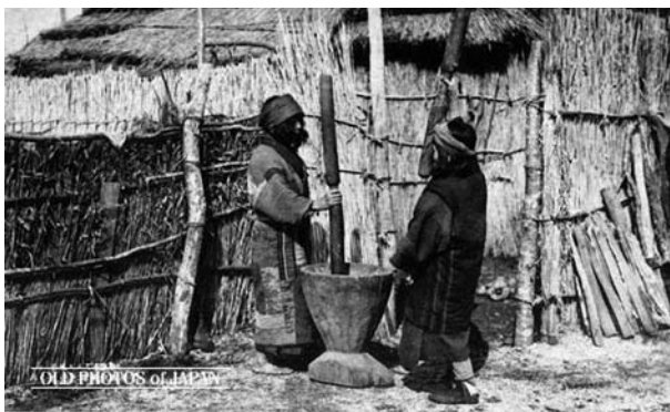
4 pvz. Dvi moterys grūdančios piestoje soras (nežinomo fotografo 1920 m. nuotrauka)

Tiesa, ne itin gausioje specializuotoje literatūroje ainų kanoninis dainavimas apibūdinamas gana glaustai. Pavyzdžiui, apie jį kartais tenka spręsti tik iš tokio trumpo aprašo: grūsdamos soras (tai praktikuojama tik pietinėje Jezo dalyje) dvi arba trys merginos sustoja aplink piestą (žr. 4 pvz.), į kurią subertos sojos, ir kiekviena mergina, laikydama abiem rankomis grūstuvą, muša ir dainuoja viena paskui kitą žodžius: huye, huye 57 .