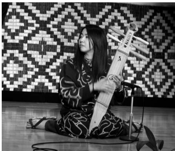
26 pvz. Ainų muzikantė, skambinanti tradiciniu muzikos instrumentu tonkori

Įdomu, kad ainų terminas haw , pažodžiui „balsas“, tinka žmogaus, paukščių ir kitų gyvūnų balsams, taip pat kai kurių muzikos instrumentų, pvz., tonkori (5 stygų citros tipo instrumentas) 130 ir vakarietiško smuiko, skleidžiamiems garsams apibrėžti 131 (plg. liet. tūtavimo reikšmes). Beje, svarbiausio ainų instrumento tonkori ypatumu, anot Tanimoto, laikytina žvaigždės formos išpjova (rezonavimo anga) dekos centre 132 (26 pvz.). Panaši išpjova (saulutės, segmentinės žvaigždės ir panašių formų) būdinga ir lietuvių penkiastygėms kanklėms (jomis Biržų krašte skambintos vokalines sutartines, 27 pvz.).