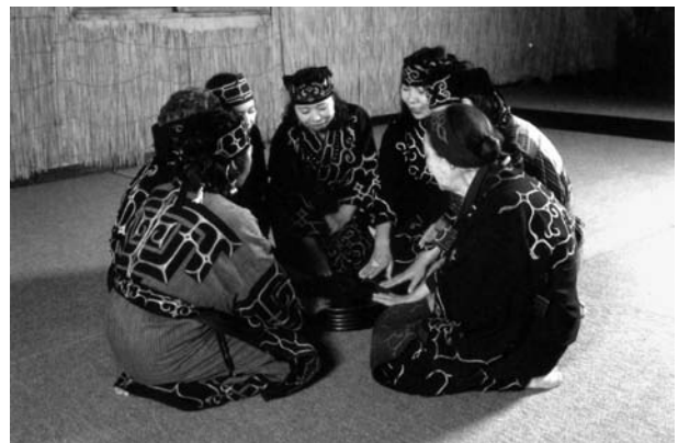
6 pvz. Dainuojama upopo („dainos sėdint“), stuksint per ritualinio indo dangtį, Asahikavos apyl. (fotografuota 1999 m.) 65

Iš literatūros ir turimų garso įrašų pavyzdžių galima spręsti, kad ainų tradicinė polifonija bene dažniausiai yra pagrįsta