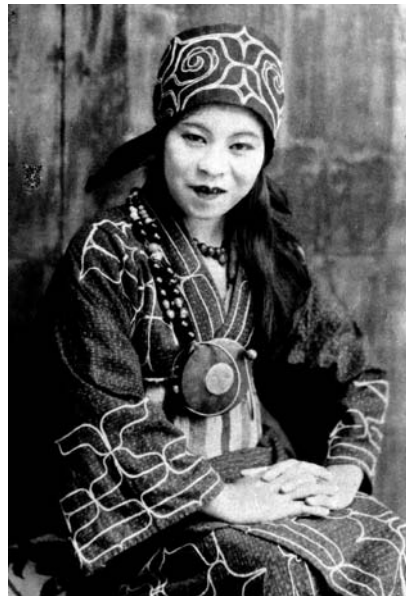
2 pvz. Ainų moteris ištatuiruotomis lūpomis (fotografuota apie 1960 m.)

Tikslų ainų skaičių nustatyti gana sunku: Japonijos gyventojų surašymuose jie neišskirti kaip tauta arba nacionalinė mažuma. Nedaug ką gali atskleisti ir onomastikos tyrimai, nes XIX a. visi ainai buvo pervadinti: gavo japonų vardus ir pavardes. Japonų mokslininkai ištyrė, kad negrynakraujų ainų (kvarteronų ir kt.) yra apie 15–16 tūkstančių. Grynakraujų, neturinčių japonų kraujo priemaišų, – ne daugiau kaip 200–300 (kai kuriais duomenimis – tik apie 160) 17 . 2008 m. ainai oficialiai pripažinti nacionaline mažuma. Pastaruoju metu ainai Japonijos vyriausybės labai remiami, jiems skiriamos dotacijos, statomi patogūs būstai.