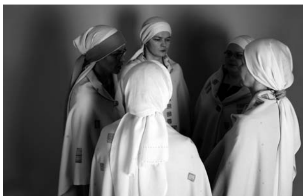
28 pvz. Sutartinių giedotojų grupė „Trys keturiose“ (Jurgitos Treintytės-Jorės nuotrauka, 2006 m.)

Labai svarbus lietuvių ir ainų polifonijos tradicijose yra dainavimas ratu (rate) . Matyt, iš dalies tai susiję su kanoniniu dainavimo principu ir įprastu 3 ar daugiau giedotojų sustojimu veidais viena priešais kitą giedant (28 pvz.).