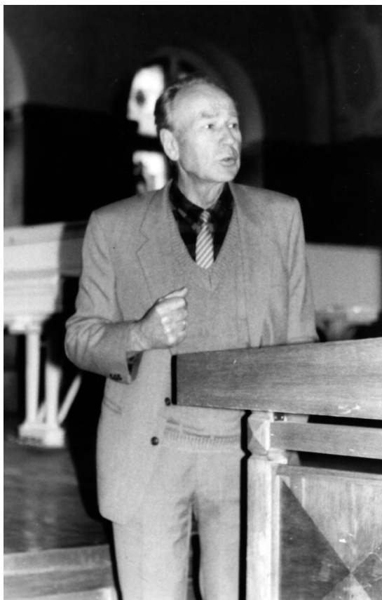
1 pav. Kompozitoriui Jeronimui Kačinskui suteikiamas Klaipėdos miesto Garbės piliečio vardas. 1991 m. spalio 2 d.