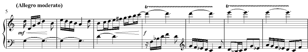
8 pav. V. Paketūro preliudo Nr. 3 iš ciklo „Penki preliudai solo kanklėms“ fragmentas (5–11 taktai)

Tai, kad V. Paketūras kūrinio dermę konstruoja sujungdamas į vieną kelis diatoniškus garsaeilius, akivaizdžiai rodo preliudai Nr. 3, 4, 5 iš ciklo „Penki preliudai solo kanklėms“. Antai minėto ciklo antrajame preliude kompozitorius gretina dvi tonacijas: G ir B mažorą. Toks garsaeilis gali būti vadinamas bitonaliu, arba sudėtinu (dvitonaciniu) 22 (8 pav.).