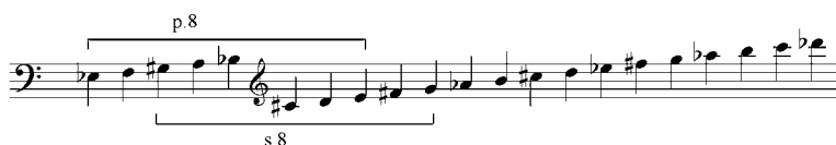
5 pav. V. Paketūro preliudo Nr. 1 iš ciklo „Penki preliudai solo kanklėms“ garsaeilis

Šioje dermėje tarp oktavos atstumu esančių garsų, be grynosios oktavos, pastebimi padidintųjų (arba sumažintųjų) oktavų ryšiai (5 pav.).