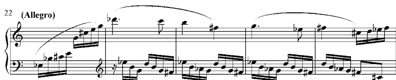
4 pav. V. Paketūro preliudo Nr. 1 iš ciklo „Penki preliudai solo kanklėms“ (1963) fragmentas (22–26 taktai)

Pirmajame šio ciklo preliude kompozitorius panaudojo dvylikatonę seriją atitinkančią chromatinę dermę (4 pav.).