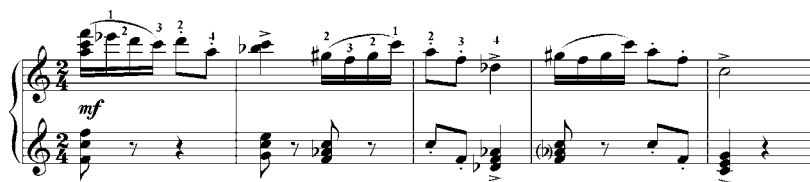
10 pav. V. Paketūro Koncerto kanklėms I dalies pagrindinės temos fragmentas (140–143 taktai)

Veržlią koncerto temų derminę dinamiką atspindi pirmosios dalies pagrindinės temos 26 (ji yra trijų dalių) harmoninis planas. Pirmoji ir antroji temos dalys turi dvi prieštaringas harmonines linijas: viena jų mažorinėmis tonacijomis ( C, B, A s , G e s ir F ) slenka žemyn, kita – minorinėmis tonacijomis ( a, d, e s ir f ) kyla aukštyn, pasitikdama vienvardžiame mažore (F-dur) suskambančią pagrindinės temos pirmosios dalies reprizą (10 pav.).