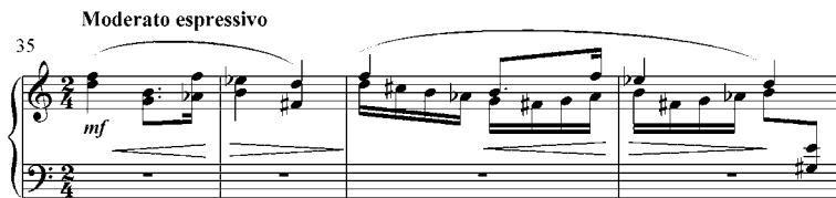
7 pav. V. Paketūro Baladės solo kanklėms (1974) antrosios temos fragmentas (35–38 taktai)

Tokiu derminiu pagrindu konstruojama muzikinė medžiaga galutinai prarado diatoniškumo požymius (7 pav.).