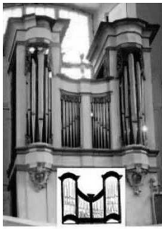
Pasiene (Latvija), 1765 m.