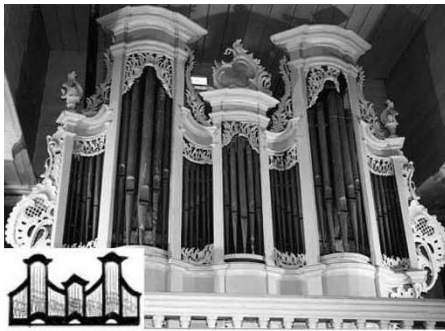
Joniškis (Molėtų r.), ~1770 m.