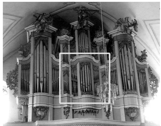
2 pav. N. Jantzono vargonai Linkuvos (1764) ir Vilniaus bernardinų (1764–1766) bažnyčiose su Hamburgo vargonų prospektams būdingu kompoziciniu dariniu – dvejų tarpinių centrinės dalies apatiniais laukeliais