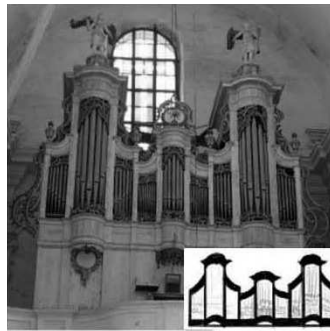
N. Jantzonas, Budslavas (Baltarusija), 1783 m.