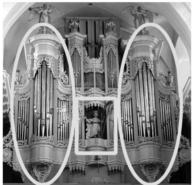
3 pav. N. Jantzono vargonai Tytuvėnų (1789) ir Troškūnų (1787–1789) bažnyčiose su didiesiems Karaliaučiaus vėlyvojo baroko vargonams būdingais bruožais – tridale kompozicija abiejuose prospekto šonuose, šoniniais bokštais su simetriškais išoriniais langeliais, karaliaus Dovydo figūra prospekto centre