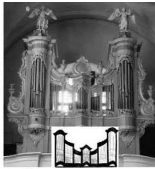
Stakliškės, po 1782 m.