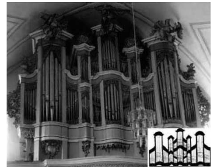
N. Jantzonas, Linkuva, 1764 m.