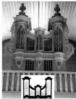
Semliškės, 1781 m.